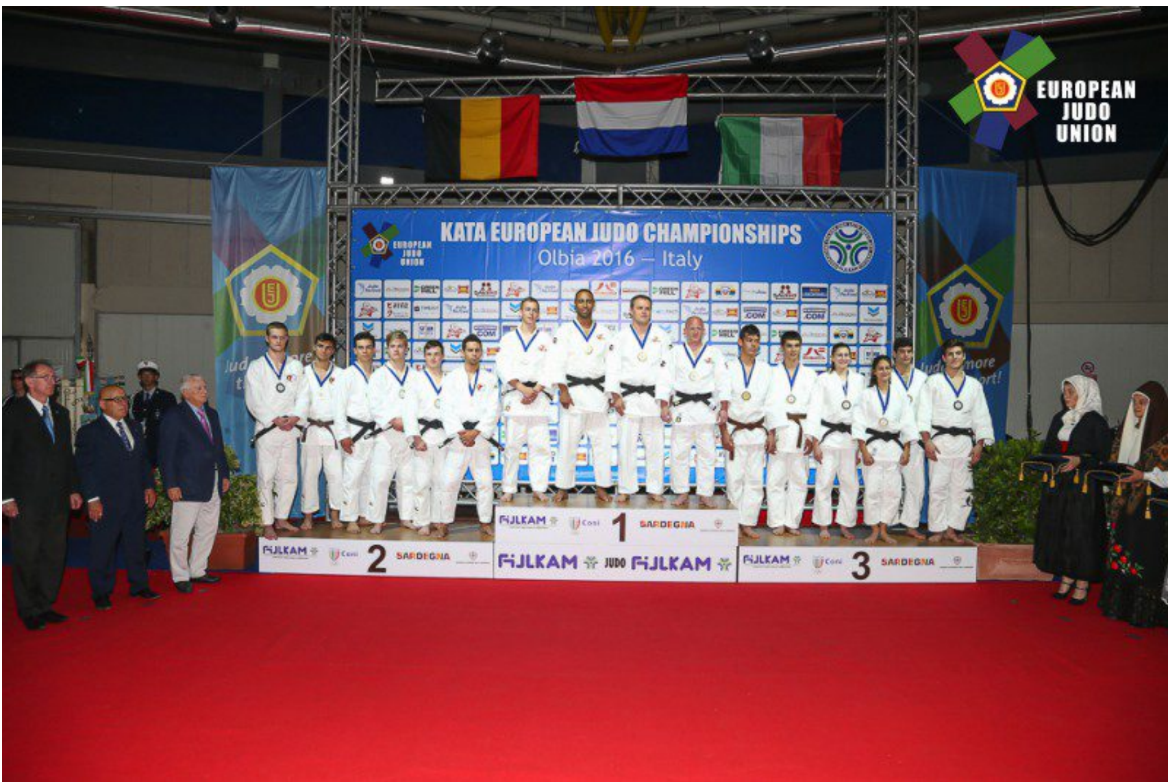
Team Italia (Judo Club Alghero) Medaglia di Bronzo ai Campionati Europei 2016

Il Judo è CORTESIA CORAGGIO AMICIZIA AUTOCONTROLLO SINCERITA' MODESTIA ONORE RISPETTO